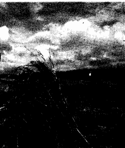
taatsbosbeheer in Westzaan.