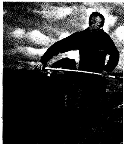
Jongeren werken in natuurgebied van Sta

De tweede manier is door scholieren langer stage te laten lopen. De coördinatiekosten dalen dan relatief. Als scholieren drie maanden fulltime stage lopen, schatten we dat